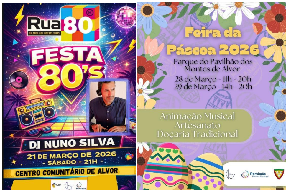
Tabela 17: Eventos e atividades diversas

Nota: Em todas as fotografias houve a preocupação de cumprir com o Regulamento Geral da Proteção de Dados (RGPD).