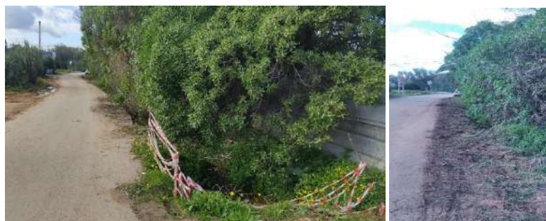
Corte de arbustos berma da estrada do caminho Tapada da Penina.