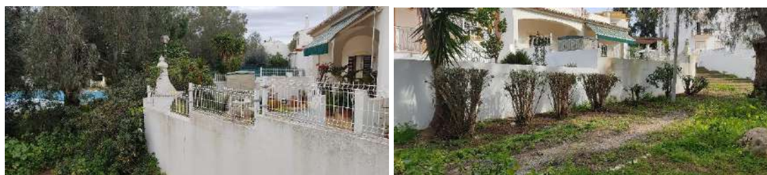
Limpeza de arbustos na Bemposta.