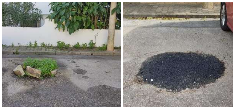
Eliminação de caldeiras na Urbanização Mar e Serra.