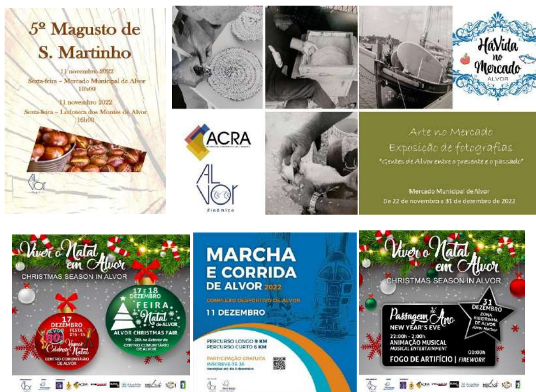
Tabela 20: Eventos e atividades diversas