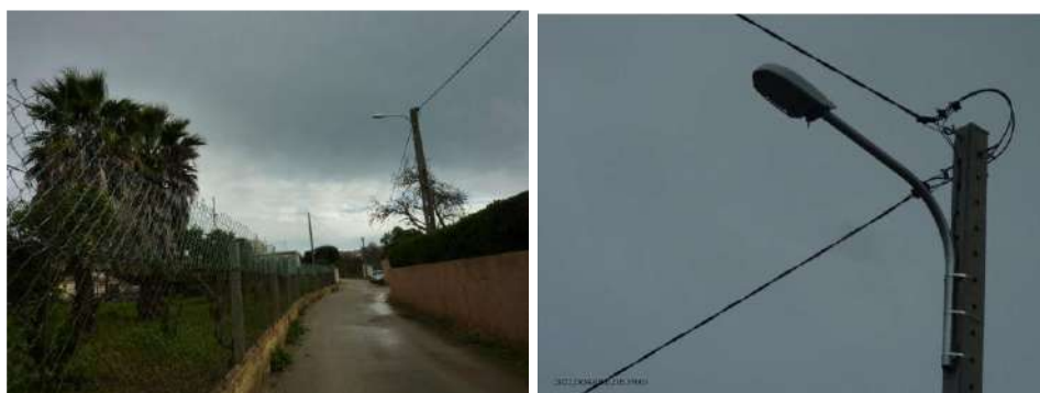
Ampliação da rede I.P. Sitio na Rua da Dourada em Alvor.