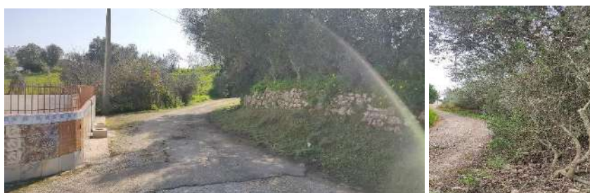
Limpeza do Caminho das Castelhanas.